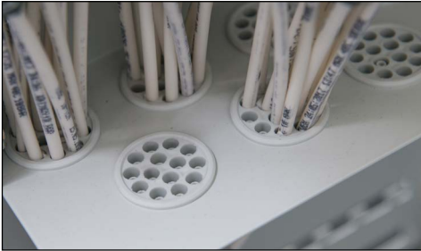
Einzelrohre in Aufteilbox einführen (max. 12 Rohre pro Einführung) Introduire les tubes dans la box de distribution