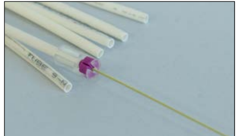
Miniduct Seal Einzelzugabdichtung auf Faserbündel anbringen und Bündel in Flexrohr einführen Mettre le Miniduct Seal, joints monolignes, sur le tube de fibre et introduire dans le tuyau flex