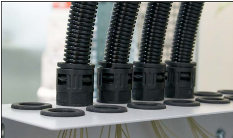
Abgehende Flex Rohre einführen Introduire les tuyaux flex qui partent de la box de distribution