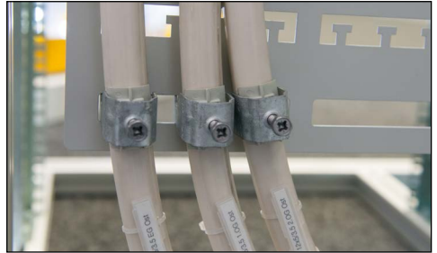
Rohrverbund mit Kabelschnellverleger befestigen Fixer le faisceau des tubes avec une bride