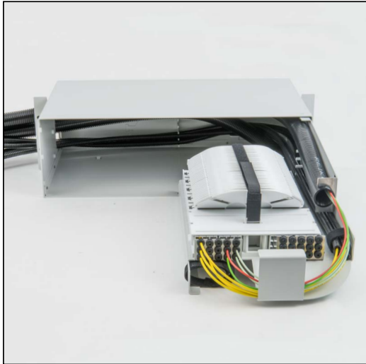
Variante NW 23 und NW 7 Variante NW 23 et NW 7